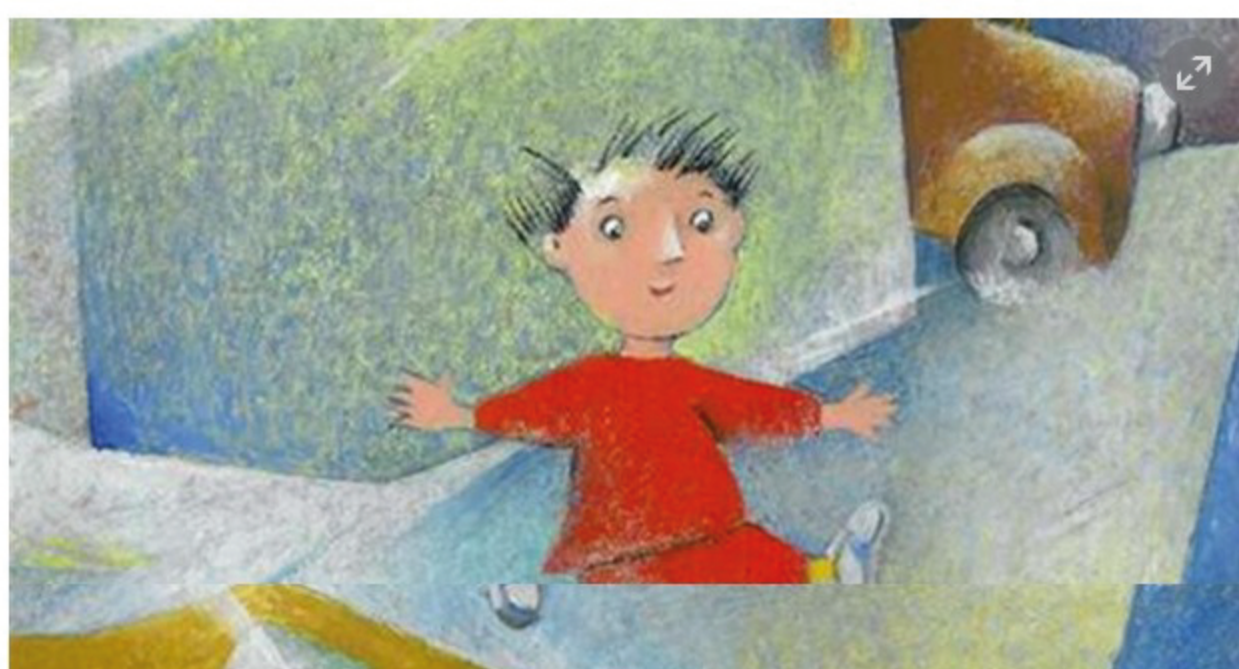
Leonardo da Vinci in una illustrazione di Letizia Galli

Nei locali dei trovatelli rinascimentali la poetica mostra dell'illustratrice per l'infanzia Letizia Galli riscatta i bambini sfruttati di oggi del mondo, unitevi