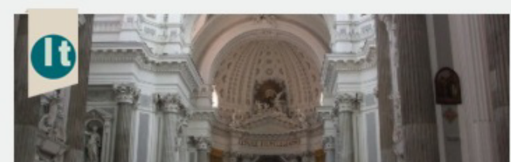
Napoli. La Basilica dell'Annunziata Maggiore e la Ruota degli Esposti