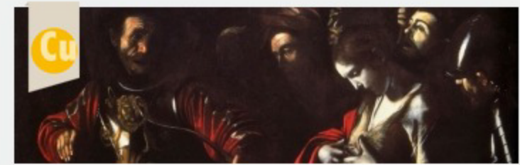
L'ultimo Caravaggio custodito a Napoli